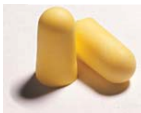
EAR CLASSIC II